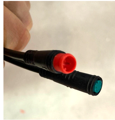
Faisceau 2 branches