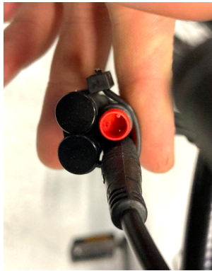
Faisceau 4 branches