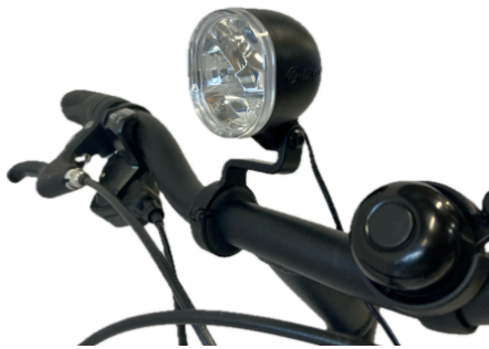
Fixation sur le guidon