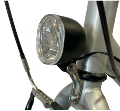
Fixation sur la fourche